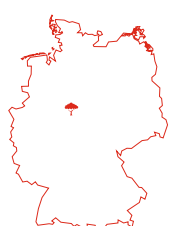
RAPP-EICHE Urwald Sababurg, Nordhessen